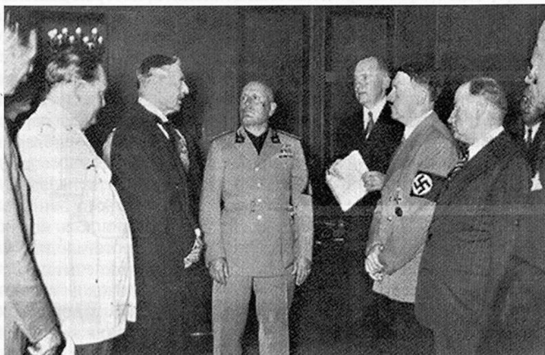
В Мюнхене все решено

ский и французский посланники прозрачно намекнули ему: «Если чехи объединятся с русскими, война может принять характер крестового похода против большевиков. Тогда Англии и Франции будет очень трудно оставаться в стороне. Что же касается договора между Францией и Чехословакией, то французское правительство ставит права судетских немцев на самоопределение (проживали на северо-западе Чехословакии) выше условий этого договора».